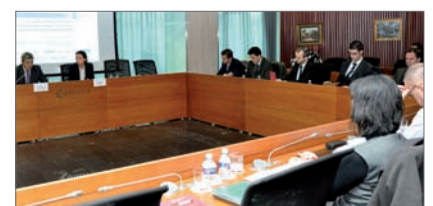
Imagen del 2º Foro Regional del Proyecto Castle

El Proyecto Castle, que cuenta con un presupuesto de más de 2 millones de euros y una duración de 36 meses, se lanzó en 2008 y en él participan socios de Italia, Polonia, Grecia, España, Alemania, Hungría y Austria.