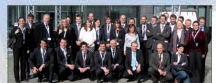
Participantes en las jornadas del proyecto Hinterport

Hinterport tiene como objetivo la creación de una red interactiva de agentes en torno al transporte intermodal en la conexión de los puertos con su hinterland , con la intención de identificar casos de éxito en toda Europa, validar su aplicabilidad, y promover los mismos a través de actividades de formación utilizando métodos novedosos y las TIC.