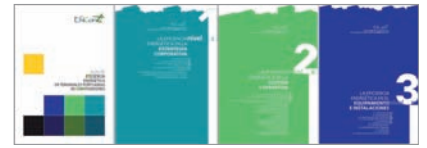
Imagen de la Portada y Separatas de la Guía de Eficiencia Energética que se repartirá en la Jornada del día 22 de marzo

Como resultado final del proyecto se ha elaborado la "Guía de Eficiencia Energética en Terminales Portuarias de