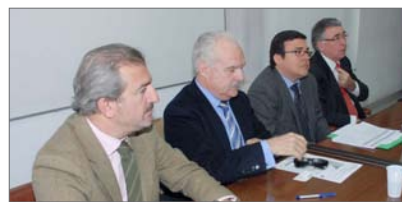
Imagen de la Presentación del Plan de Competitividad

De este análisis se derivan una serie de líneas de actuación para las empresas