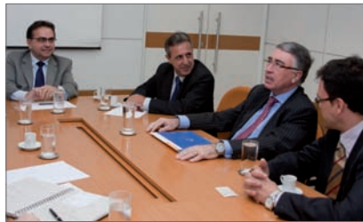
Imagen de la reunión mantenida entre representantes de la Fundación Valenciaport y de la Embajada de España en Brasil con el Ministro Leónidas Cristino de la SEP (Brasil)

En dicho contexto y aprovechando las reuniones técnicas al respecto, Leandro